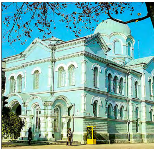
Biserica transformată în Planetariu și Centru de ateism (au funcționat din 1962 până în 1990) (imagine din anii '80 ai sec. XX).

tor ocular, fost elev al liceului care, în acea perioadă, s-a aflat în trecere pe acolo [4, p. 132]. Reîntors la Chișinău (1942-1944), întrucât clădirea fusese distrusă în timpul războiului, liceul a funcționat în cea a fostei Facultăți de Teologie, până la o nouă evacuare la Craiova,