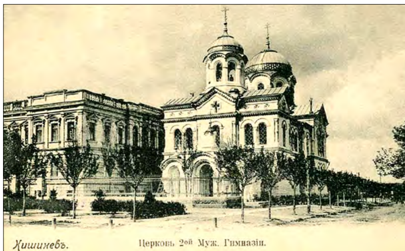
Biserica Gimnaziului nr. 2 de băieți din Chișinău (începutul sec. XX).