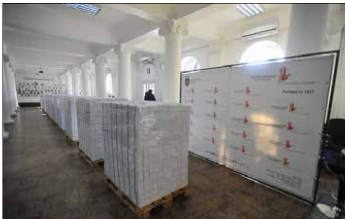
Expoziția La datorie

tarea, diferențierea prin evidențierea nuanțelor specifice ș.a.).