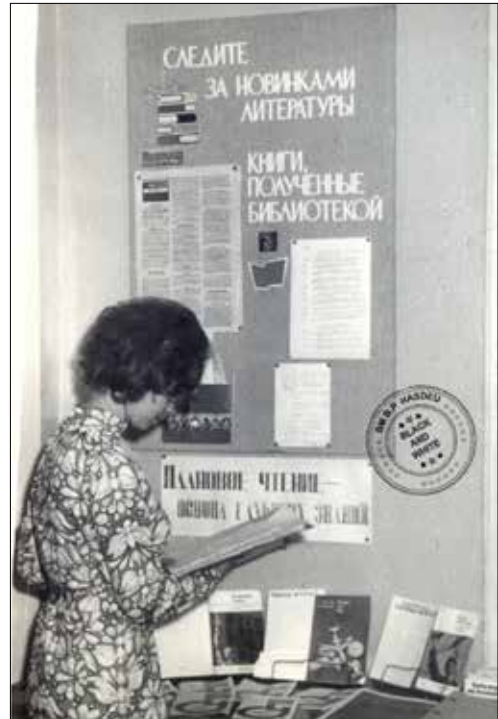
Noi intrări promovate cu ajutorul panoului informativ

Variațiile expozițiilor moderne au menirea de a ului utilizatorii bibliotecii, de a le suscita și menține viu interesul pentru cărțile, serviciile și activitățile bibliotecii. În prezent bibliotecarii moderni apelează la diverse tehnici împrumutate din domeniul designului, marketingului, brandingului pentru a surprinde cititorii (jocul cu culorile și dimensiunile, principiile contrastului, alinierii, repetiției, alternanței, progresiei, echilibrului asimetric, simetriei radiale, focusarea pe detalii, amplasarea strategică, orientarea spre necesitățile informaționale ale utilizatorului, reinven-