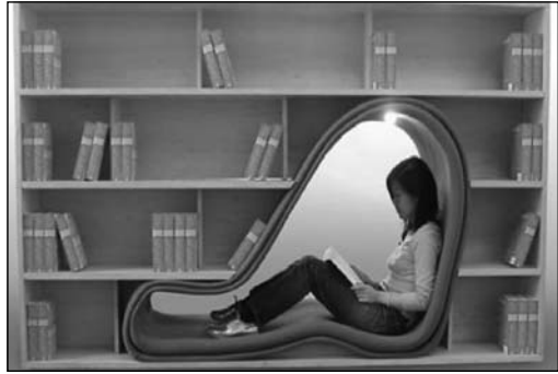
Loc pentru lectură

Spațiul pentru expoziții, noutăți editoriale și serviciul de referință sunt parte componentă a spațiului de lectură. Bibliotecile publice includ spații pentru adulți, copii și tineri. Gama de servicii oferite utilizatorilor și spațiile disponibile pentru fiecare serviciu depinde de dimensiunile bibliotecii. Se ține cont de elementele arhitecturale necesare. Spațiile interne ale bibliotecilor și părțile componente ale colecțiilor sunt identificate – locuri pentru adulți, pentru copii și tineri.