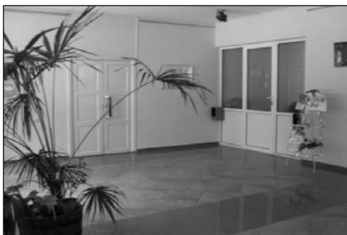
4) hol, WC, garderobă