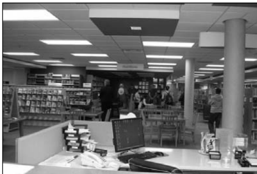
2) sală de lectură