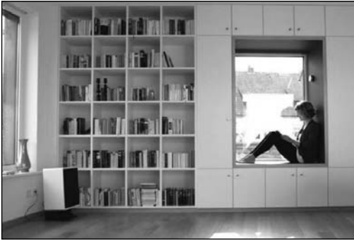
Stelaj – loc de lectură