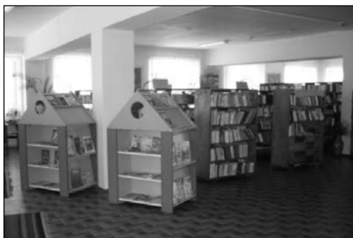
3) împrumut pentru copii