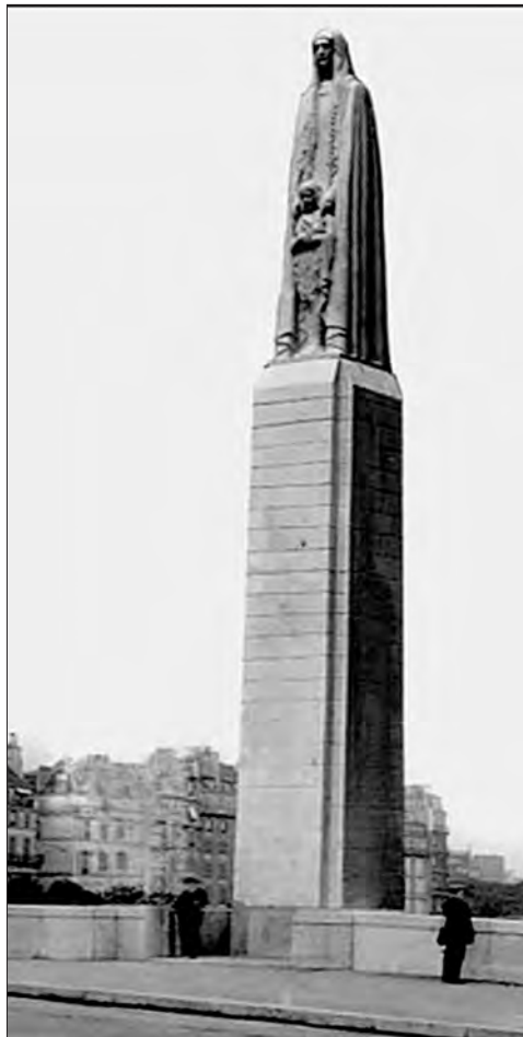
Fig. 8. Statuia Sfânta Geneveva protejând Parisul în atelierul artistului și pe pod

Statuia este amplasată pe podul La Tournelle de peste Sena, având o înălțime de 5,4 m, fiind așezată pe un postament de 14 m 1 .