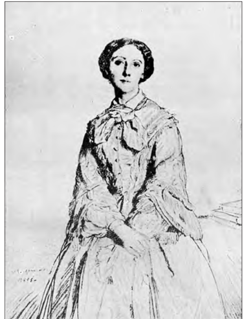
Fig. 4. Maria Cantacuzino. Desen de Chassériaux. 1855

Pentru a înțelege influența atât de puternică pe care a avut-o prințesa Cantacuzino asupra pictorului, este semnificativă percepția biografului acestui pictor, Marius Vachon, care, din studiile făcute, a sintetizat această legătură sufletească și profund culturală într-o frază convingătoare: „Înalta ei inteligență, instrucțiunea ei superioară, intuiția artistică, care prin studiul operelor marilor maeștri în cursul