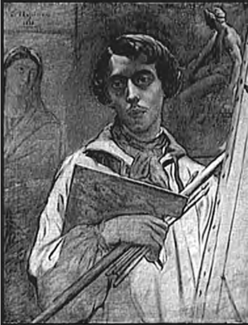
Chassériaux. Autoportret. 1838. Musée du Louvre