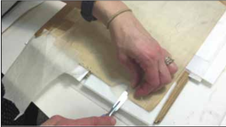
Fig.5. Creșterea părții lipsă a paginii cu utilizarea hârtiei japoneze

doar în cazuri excepționale. Unul din motive ar fi că mărește considerabil nevoia de spațiu, dacă până la încapsulare fila are 0,01 mm, după încapsulare grosimea ei crește de până la 0,05 mm.