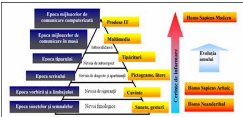
Fig. 1. Stadiul actual al patrimoniului documentar al Bibliotecii Naționale

În cele ce urmează vom descrie particularitățile prezervării patrimoniului cultural în cadrul Bibliotecii Naționale a Republicii Moldova.