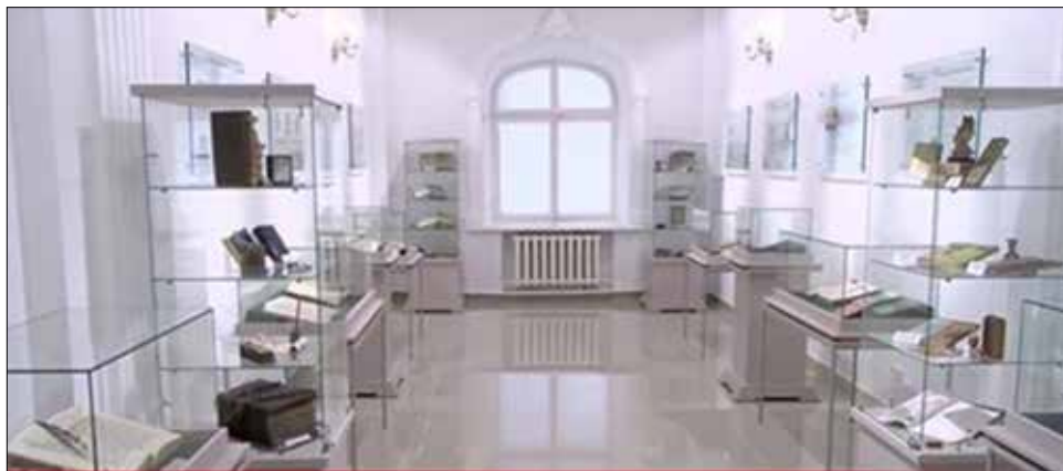
Fig. 4. Spațiul expozițional „Muzeul Cărții”

ținut cont de condițiile pe care trebuie să le întrunească un spațiu muzeal modern, care prevede ca 50% din spațiul distribuit să fie rezervat pentru expoziție, restul spațiului fiind pentru personalul științific. Securitatea perimetrului spațiului muzeal se bazează pe supravegherea permanentă a intrărilor. Fereastra este prevăzută cu gratii și sistem de alarmă. Măsurile de securitate vor permite expunerea bogăției cultural-literare, parte componentă a patrimoniului național documentar al Republicii Moldova, depozitat în colecțiile speciale ale Bibliotecii Naționale a Republicii Moldova.