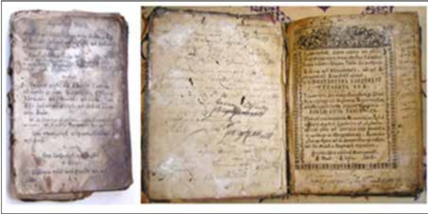
Fig. 2. Efectele acțiunii factorilor biologici asupra documentelor

țele cu relief compus. Curățarea umedă presupune aplicarea tratamentelor care hidratează obiectul parțial sau în întregime. Este aplicat îndeosebi cărților cu coperti din piele sau pergament. Prin metoda umedă mai sunt îndepărtate și petele de ceară, straturile aderente ale benzilor adezive. Nedepistarea la timp a dăunătorilor biologici duce la modificări ireversibile în structura fizică a documentelor, se produc modificări la nivelul cromatic și pierderea parțială sau totală a suportului.