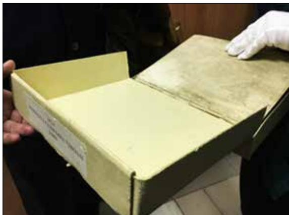
Fig.6. Cutii cu Ph neutru pentru documentele patrimoniale

microbiană, incendii, inundații, vandalism. Biblioteca Națională are prevăzut în perspectivă munca asupra elaborării unui plan strategic care va fi orientat pe trei direcții: identificarea riscurilor, măsuri operative pentru diminuarea impactului negativ și măsurile de recuperare a materialului deteriorat. Deocamdată, una dintre măsurile pentru cazuri de dezastru este instruirea colaboratorilor în manipularea stingătoarelor de incendiu, care se găsesc în numărul necesar în depozite. De asemenea, există planurile de evacuare pentru situațiile excepționale. Dacă e să comparăm varietatea programelor de prezervare existente în comunitatea eu-