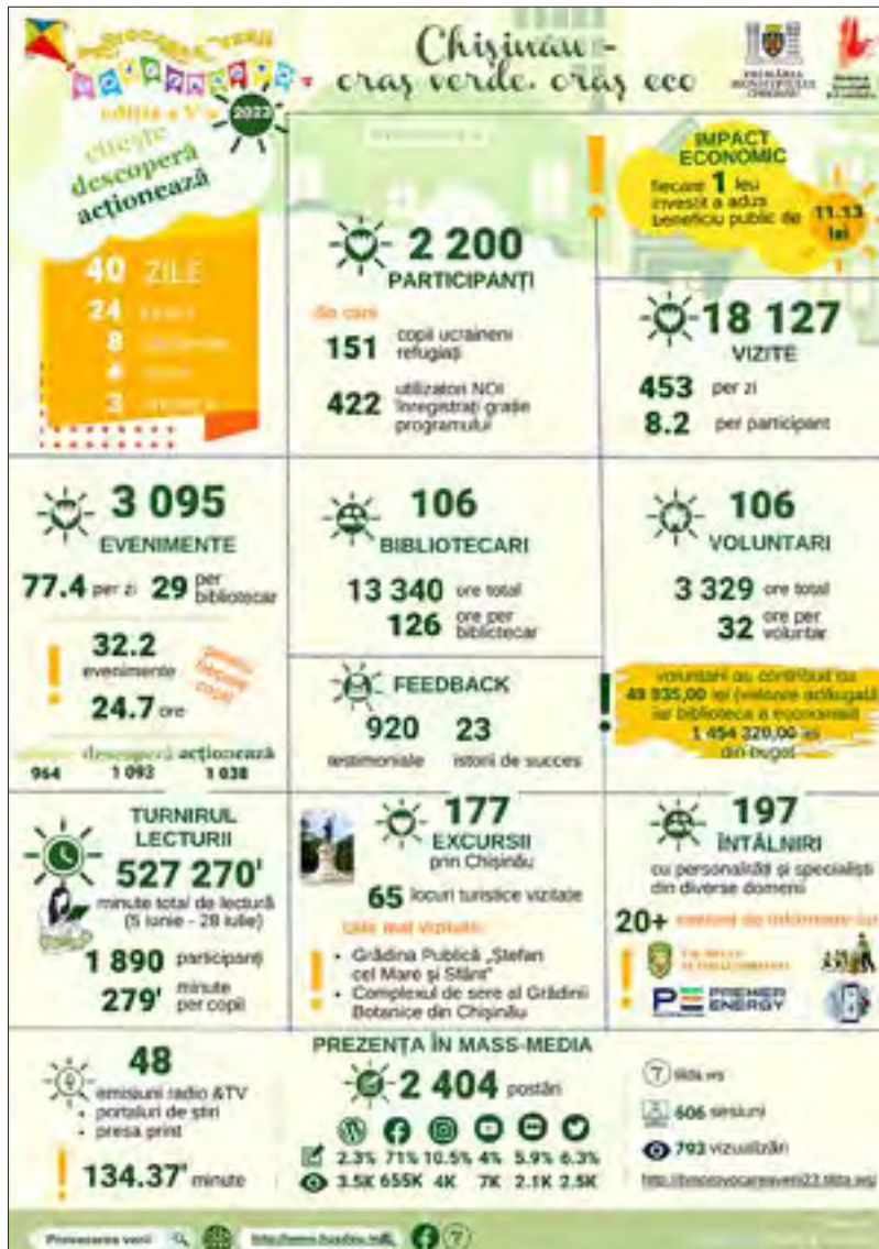
Programul „Provocarea verii” 2023. Infografic realizat de Svetlana JAVELEA